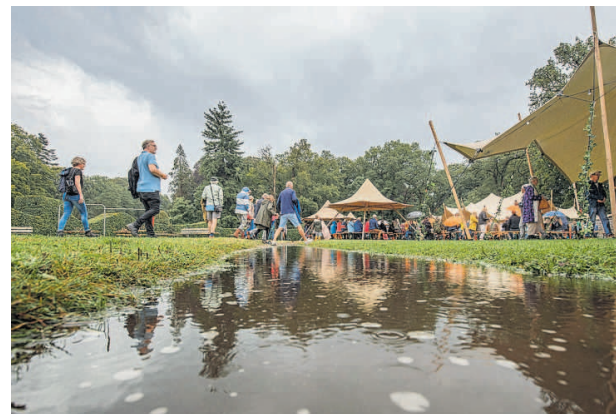
Wateroverlast op het festivalterrein.