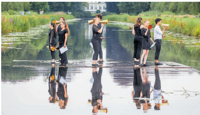
Zangers en 'roep-toeters' op het water, in The Trouble With Double Vision , de nieuwe compositie van Diamanda Dramm.

“MUSICI SPEELDEN OP MAGISCH FRAAI UITGELICHTE PLEKJES